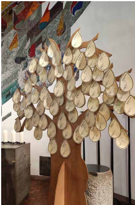
Senfkornbaum zur Nachhaltigkeit aus dem Konfigottesdienst