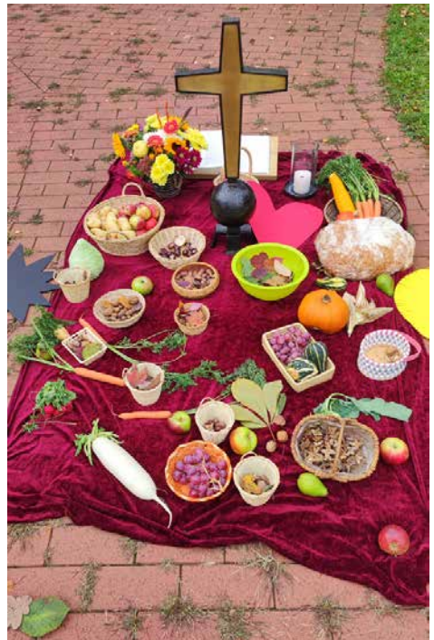
Erntedank-Decke aus dem Erntedankgottesdienst